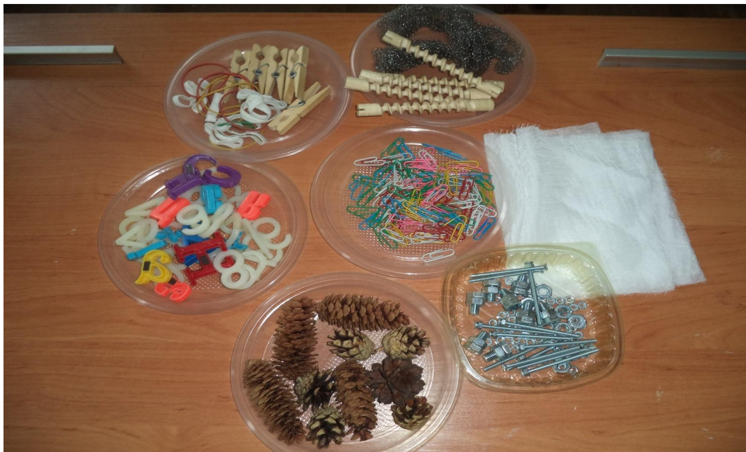
Предметы для самомассажа