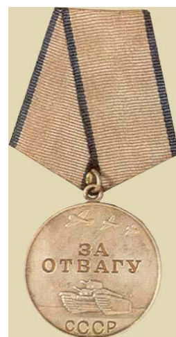
Медаль «За отвагу» II степени