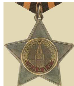
Орден Славы II