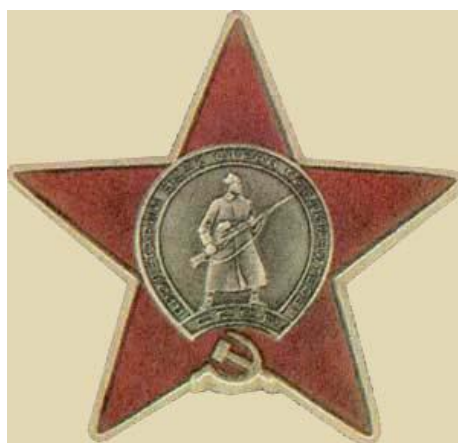
Орден Красной Звезды