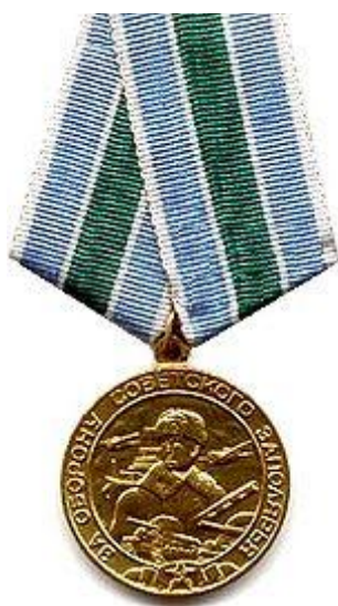
Медаль «За оборону Советского Заполярья»