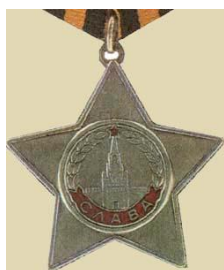
Орден Славы III Степени